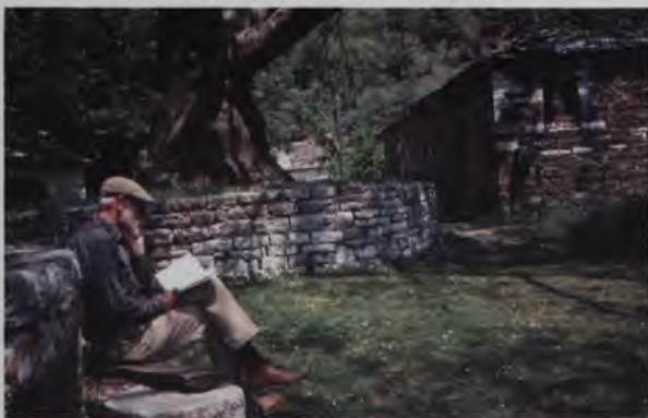
Edward Clark Crossett Professor of Humanistic Studies, Stanford University, 1977–1990